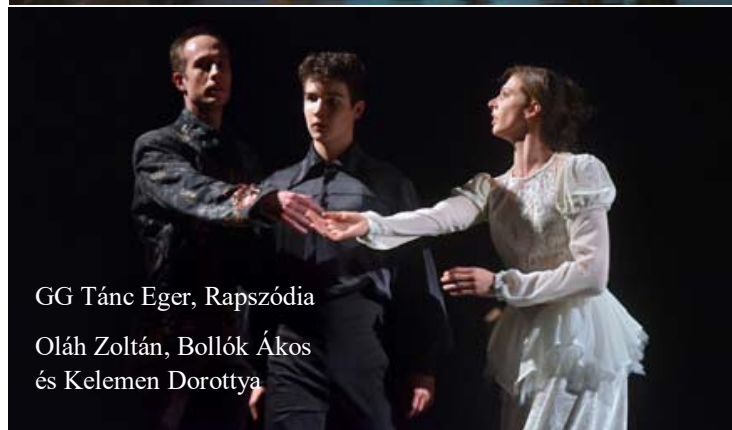
GG Tánc Eger, Rapszódia