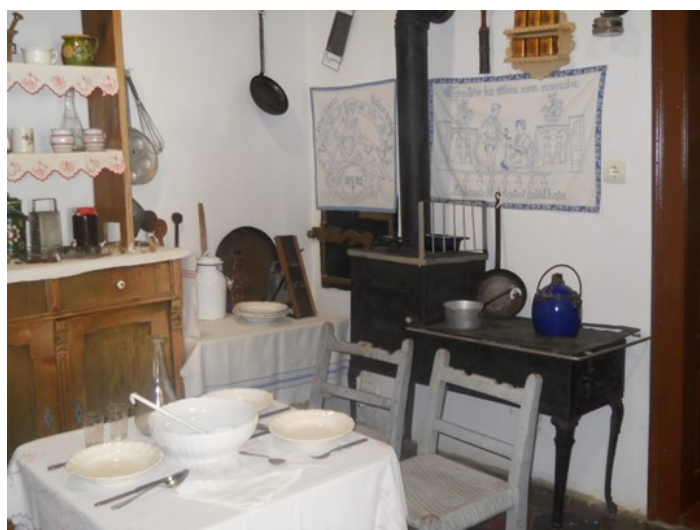
Bondorka Néptánc Tábor 2020.

2020. júliusában megrendezésre került a Bondorka néptánc csoport tábora. A táborban 16 gyermek vett részt, mindennek a Petőfi Művelődési Ház adott otthont, amelyet köszönünk szépen a Polgármester úrnak és az Önkormányzatnak, hogy lehetőséget adott, illetve támogatták az ötletet. A néptánc tábor 3 napra volt megrendezve. Különböző színes programokkal töltöttük el délutánjainkat, délelőttönként pedig természetesen táncoltunk, népdalokat tanultunk, illetve népi játékokat sajátítottunk el a gyermekekkel. Programjaink közt voltak olyanok mint: viselet bemutató, néprajz ismeretterjesztő kvíz, népi egy- egy tájegységből kivett hajfonást tanultak a lányok, illetve csoportépítő játékokat is ismerhettek meg.